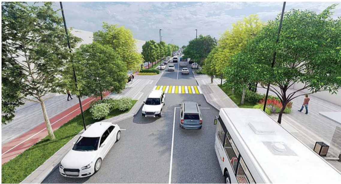
Визуализация. Улица Коркмасова, от Университетской площади до ул. Дахадаева