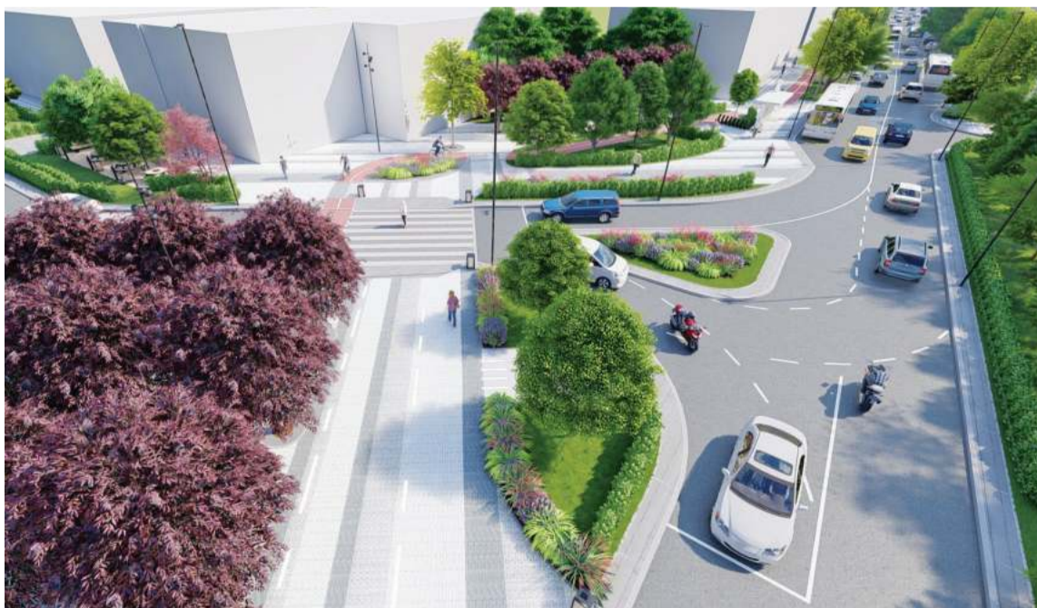
Визуализация. Университетская площадь

Сейчас специалистами городского Управления транспорта проводится информационно-разъяснительная работа, затем будут привлечены представители столичного ГИБДД – неправильно припаркованный транспорт эвакуируют, а в отношении нарушителей будут применены меры административного воздействия. На всем участке, по которому восстановлено движение транспорта, уже нанесена дорожная разметка, рабо-