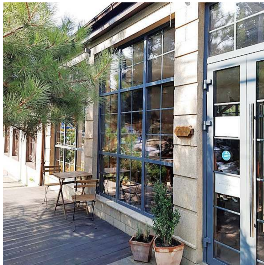
Чистая территория сразу бросается в глаза

Пол, потолок и фурнитура отлично гармонируют между собой, создавая ат-