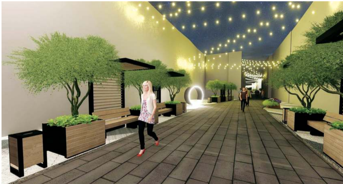
Визуализация. Улица Белинского

цы в пешеходный рай, полностью решить проблему пробок, улучшить экологию и создать в центре тихую гавань, а потому держат курс на максимальную свободу от машин. И многим из них это удалось.