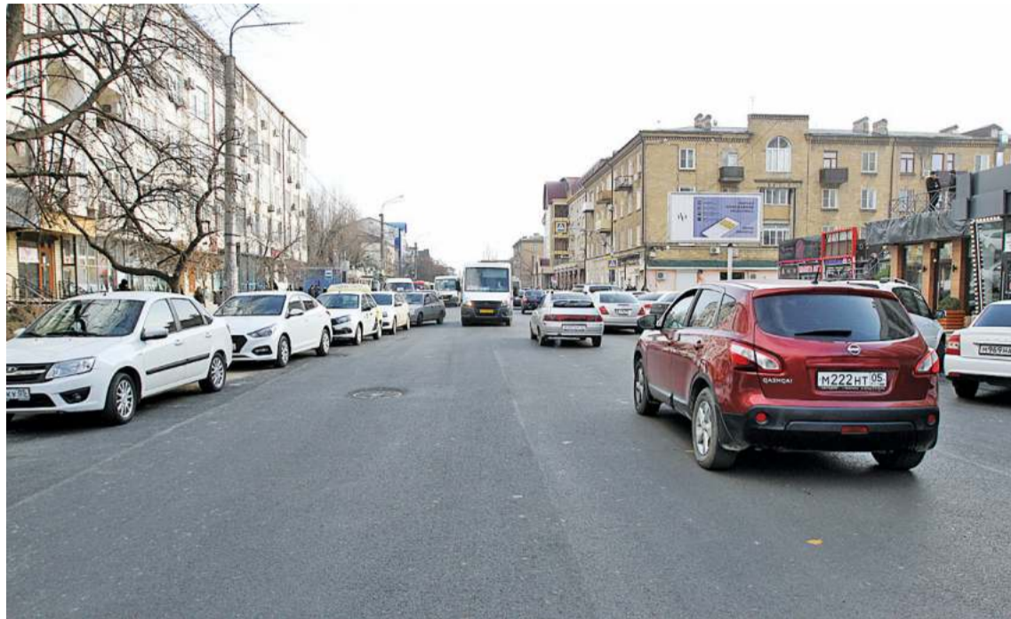
На некоторых участках движение будет ограничено двумя встречными полосами

Поразительно, насколько отличается описание российских нор-