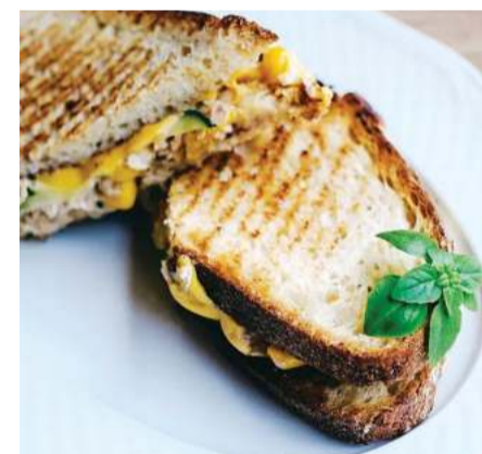
Для ценителей морепродуктов

Эспрессо-тоник, кофе-тоник или кофе-тоник – все это разные названия простого и понятного в приготовлении