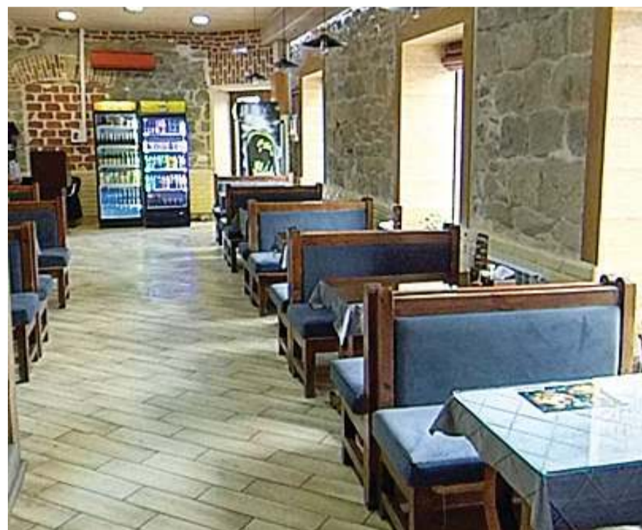
Второй этаж заведения выглядит более презентабельно