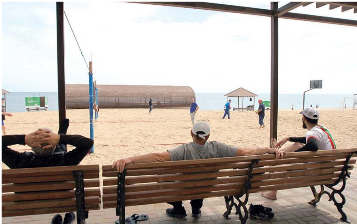
Будут построены новые навесы и увеличено количество скамеек

– Хочу отметить, что мы неоднократно обращались к городским властям с просьбой включить в проект «Формирование комфортной городской среды». Нашим просьбам внял только мэр Махачкалы Салман Кадиявович , который держит на контроле все, что происходит в городе и, в частности, на