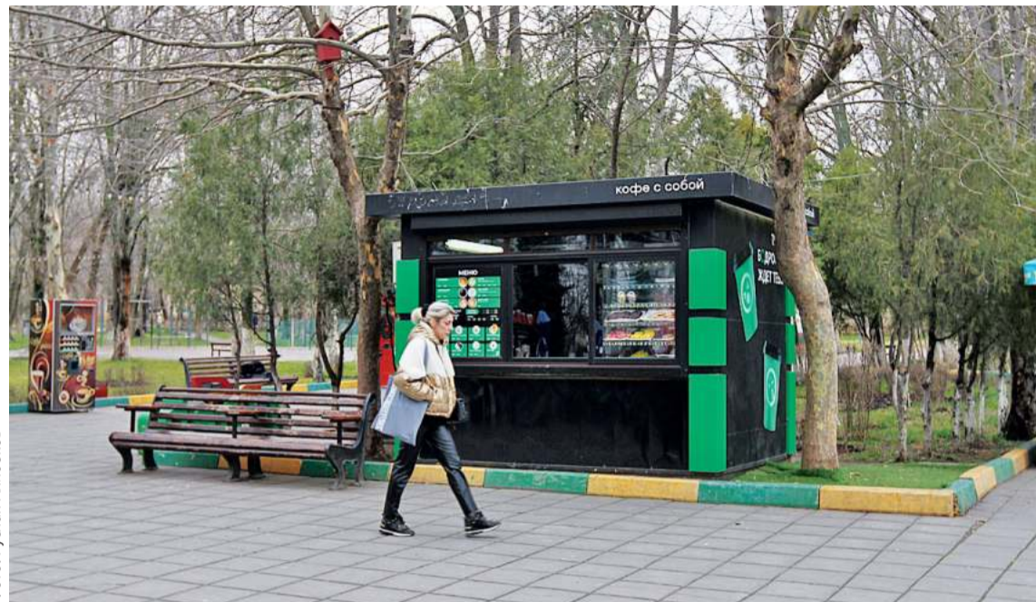
Вот так будут располагаться киоски чтобы не мешать пешеходам

В парке им. 50-летия Октября осталось всего около 30 торговых точек. Сразу обращаешь внимание, что исчезли стихийные рынки с бабулями и аляповатые холодильники и будки. 30 торговых точек – это, конечно, немало, но большая часть – это сезонные точки, и они хотя