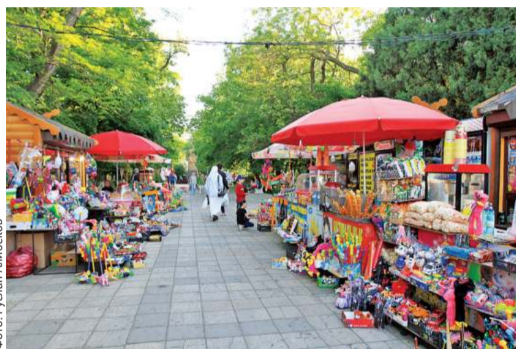
Торговые точки на Родопском бульваре сконцентрированы в одном месте

– Все имеют договор, официально оформлены, платят налоги в бюджет города и аренду парку. Нелегалов удалось в буквальном смысле выбить из парков. Хотя попытки где-то пристроиться и начать нелегальную торговлю не прекращаются, но так как посменно кто-то из наших работников (МБУ) все время в каждом из парков обязательно присутствует