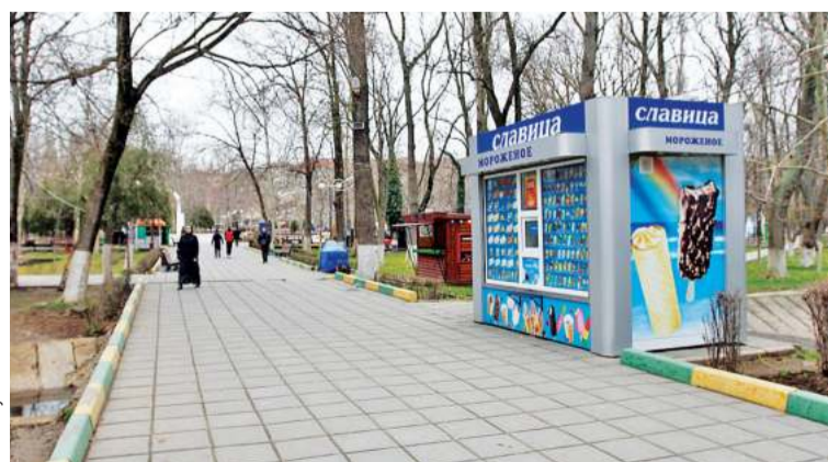
После утверждения схемы парков, даже из этих торговых точек не все останутся

Все это я к тому, что нужно уметь видеть и ценить то, что есть, и отделять зерна от плевел. Парки в Махачкале сегодня обрели настоящее руководство, и это видно даже по чистоте, которая в них поддерживается. И если мы не можем помочь и похвалить людей за работу, то, наверное, стоит это сделать. Тем более что руководство предприятия к диалогу открыто.