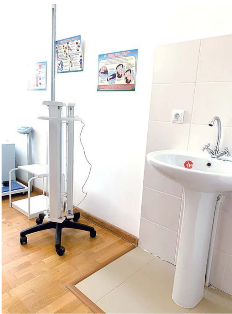
Та же самая ситуация и в детском саду