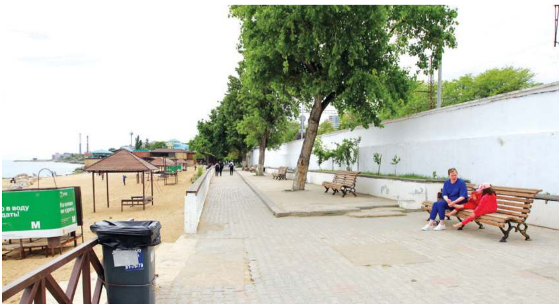
Тротуарная плитка будет заменена, а забор оформлен горным камнем

Проект реконструкции подготовлен Управлением архитектуры и градостроительства Администрации Махачкалы: его сотрудники неоднократно приезжали сюда, узнавали, что необходимо сделать в первую очередь. Были проведены выездные совещания, в которых