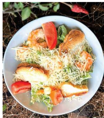
«Цезарь» с креветками

Кафе «Safar» располагается на достаточно оживленной улице Кормасова, поэтому