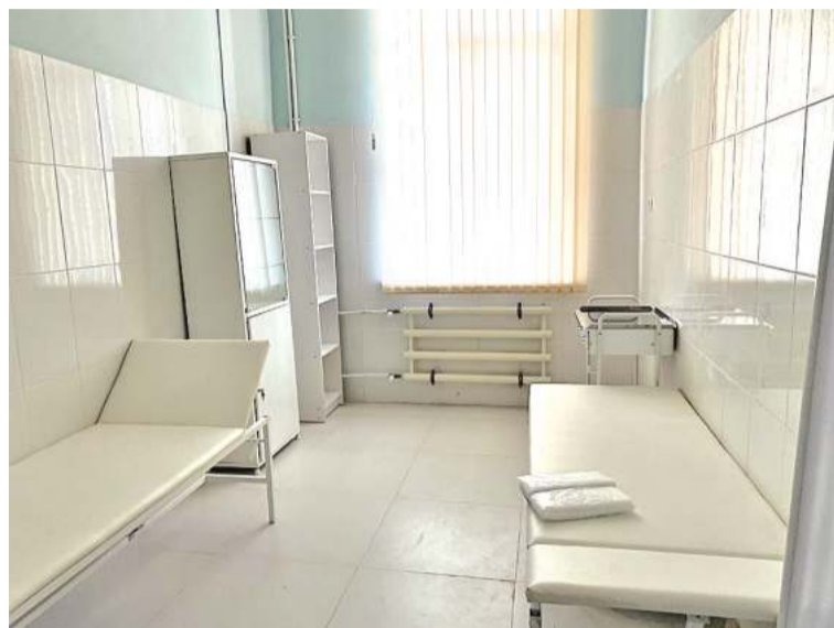
Медкабинет в школе пока пустует