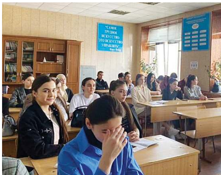
Профилактические беседы в школе

Также на сайте городской администрации есть номера, по которым граждане могут обратиться по поводу волнующих их вопросов в рамках наших полномочий. Телефон горячей линии администрации Махачкалы: 8 (8722) 67-21-34. Также существует антинаркотическая линия: 8 (800) 533-80-88. У нас также имеется собственный телеграм-канал, на который можно перейти по ссылке-приглашению @bezopasnost_mkala и получить всю актуальную информацию к этому часу.