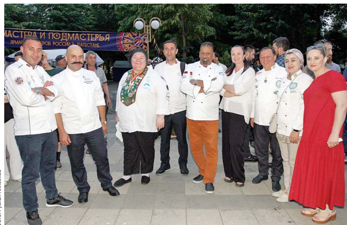
В фестивале принимали участие именитые шеф-повара

Его они называют на свой манер: «махачкалиинино». Месяц назад на чемпио- ➤➤