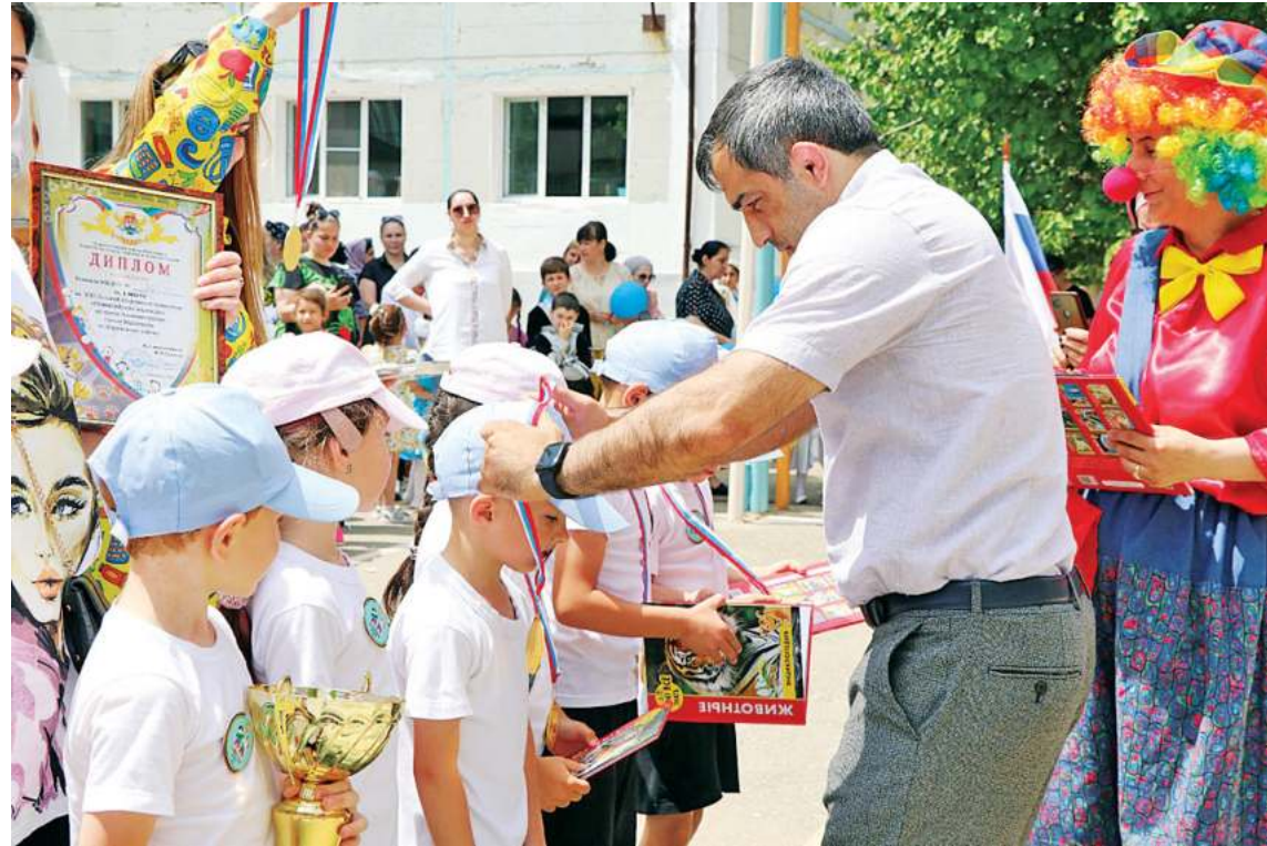
Награждение юных спортсменов

К примеру, по линии развития спорта перед нами стоят задачи разнообразить варианты спортивных дисциплин, которыми могут заниматься молодые люди в городе. Раньше вся молодежь у нас ходила на борьбу и бокс, а те, кому не нравится или противопоказаны эти виды спорта, не могли найти