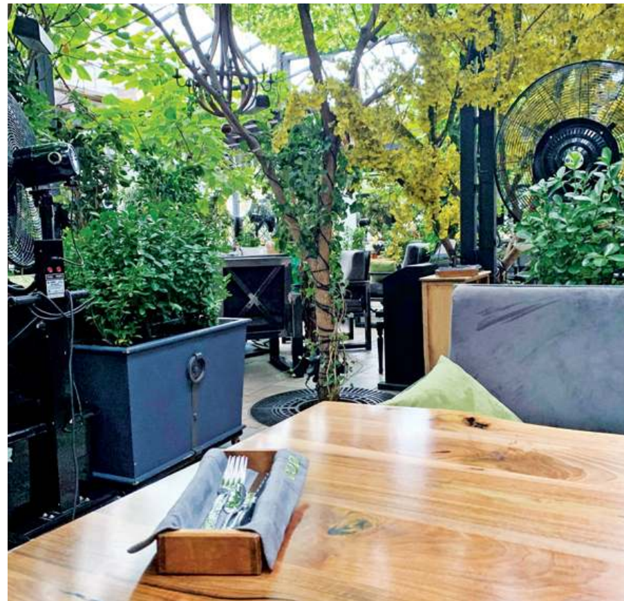
Дизайнеры постарались на славу

А вот фасад выглядит слегка нелепо. Во-первых, размер букв в названии выглядит несоизмеримо маленьким. Вывеска должна быть более масштабной и зазывать клиентов с первого взгляда. Но зато шрифт выполнен безукоризненно. В растительной тематике. Все как полагается.