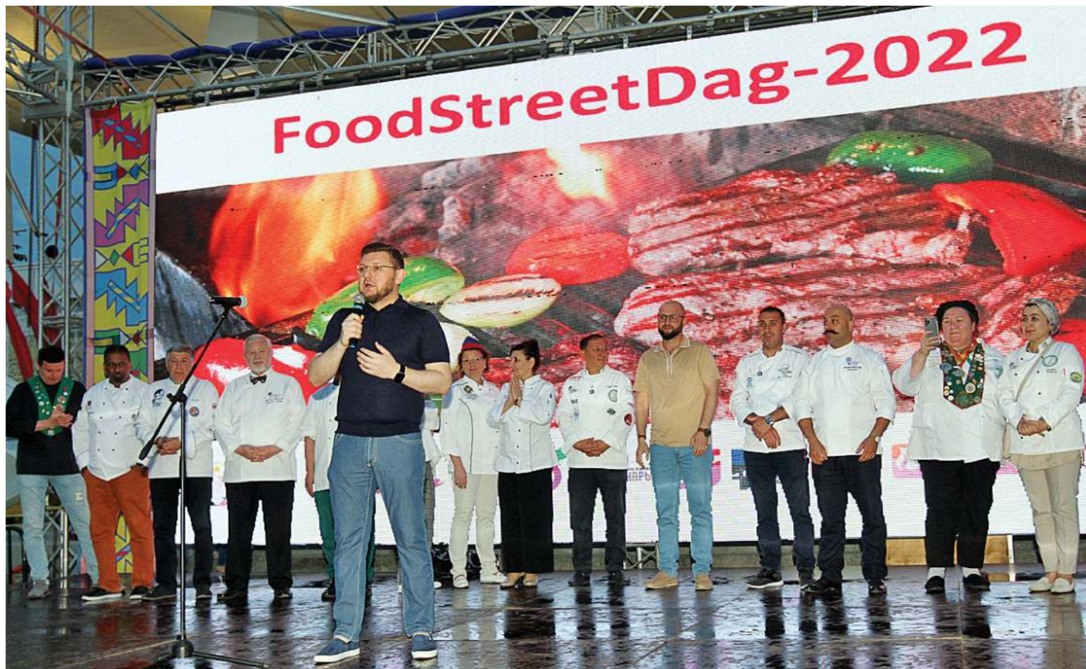
Салман Дадаев на торжественном закрытии

Среди жюри фестиваля были представлены именитые мишленовские шефы Алан Джошуа Пайен