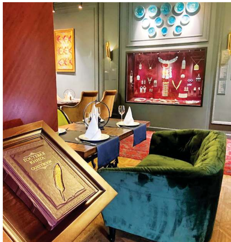
Непринужденный и многогранный дизайн

гранный дизайн, состоящий из множества незаурядных элементов. Думаю, они пытаются угодить широкому кругу гостей с разными ожиданиями.