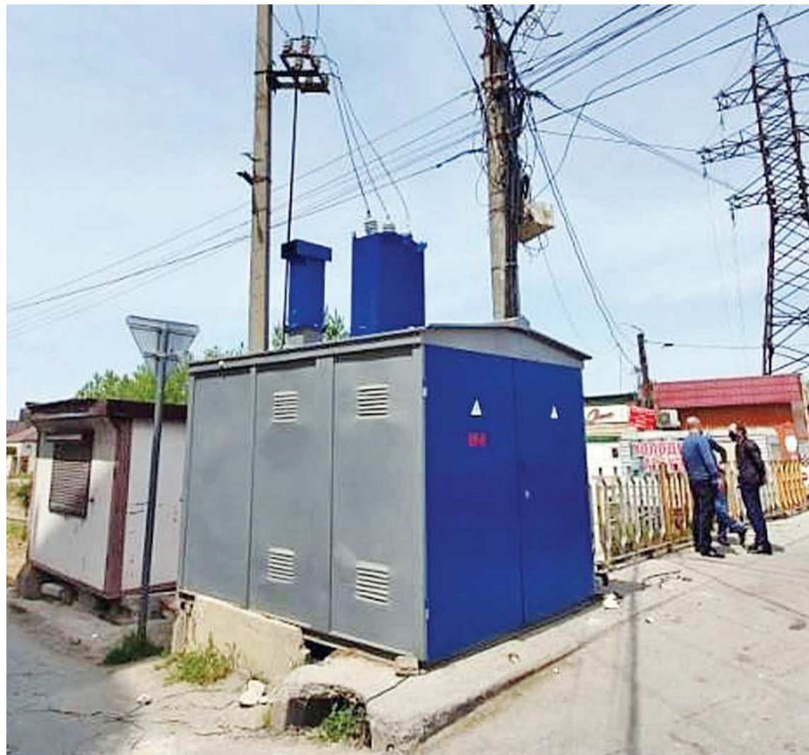
Бесхозное имущество – одна из ключевых проблем энергоотрасли Дагестана

– Формально они никому не принадлежат, так как на них нет правоустанавливающих документов. Но по факту их вынуждены обслуживать мы. Конечно, такое положение дел негативно сказывается на состоянии всей энергосистемы. Ведь сетевой организацией, которой и является АО «Дагестанская сетевая компания», средства заложены только на обслуживание электросетей, находящихся на ее балансе либо в аренде. Ремонтную деятельность Общество осу-