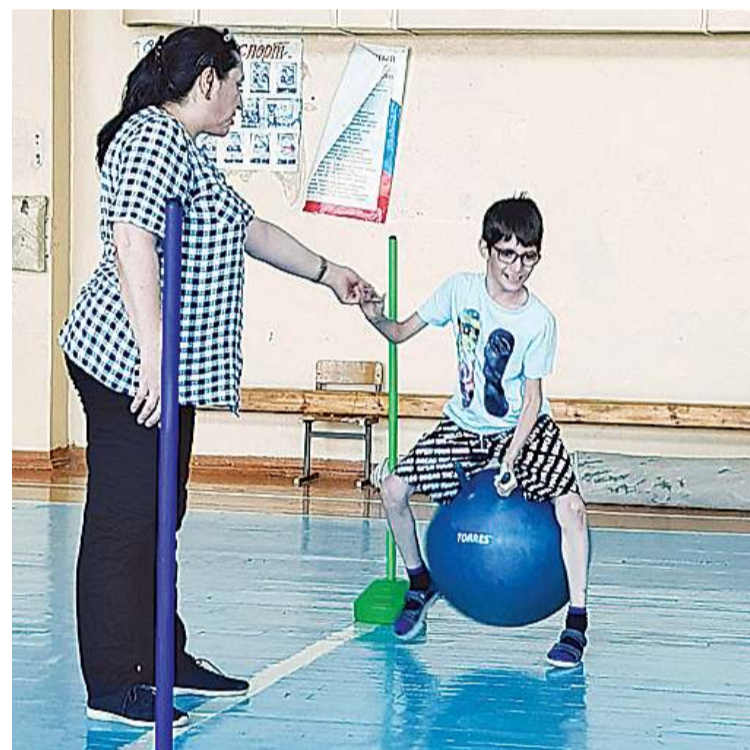
В здоровом теле - здоровый дух

– С 6 июня по 27 июля были организованы две смены лагерей на базе 8 образовательных организаций: «СОШ №2», «Лицей №9», «СОШ №16», «Гимназия №33», «СОШ №48», «СОШ №59», «СОШ №60», «СОШ №61» с общим охватом 1600 детей.