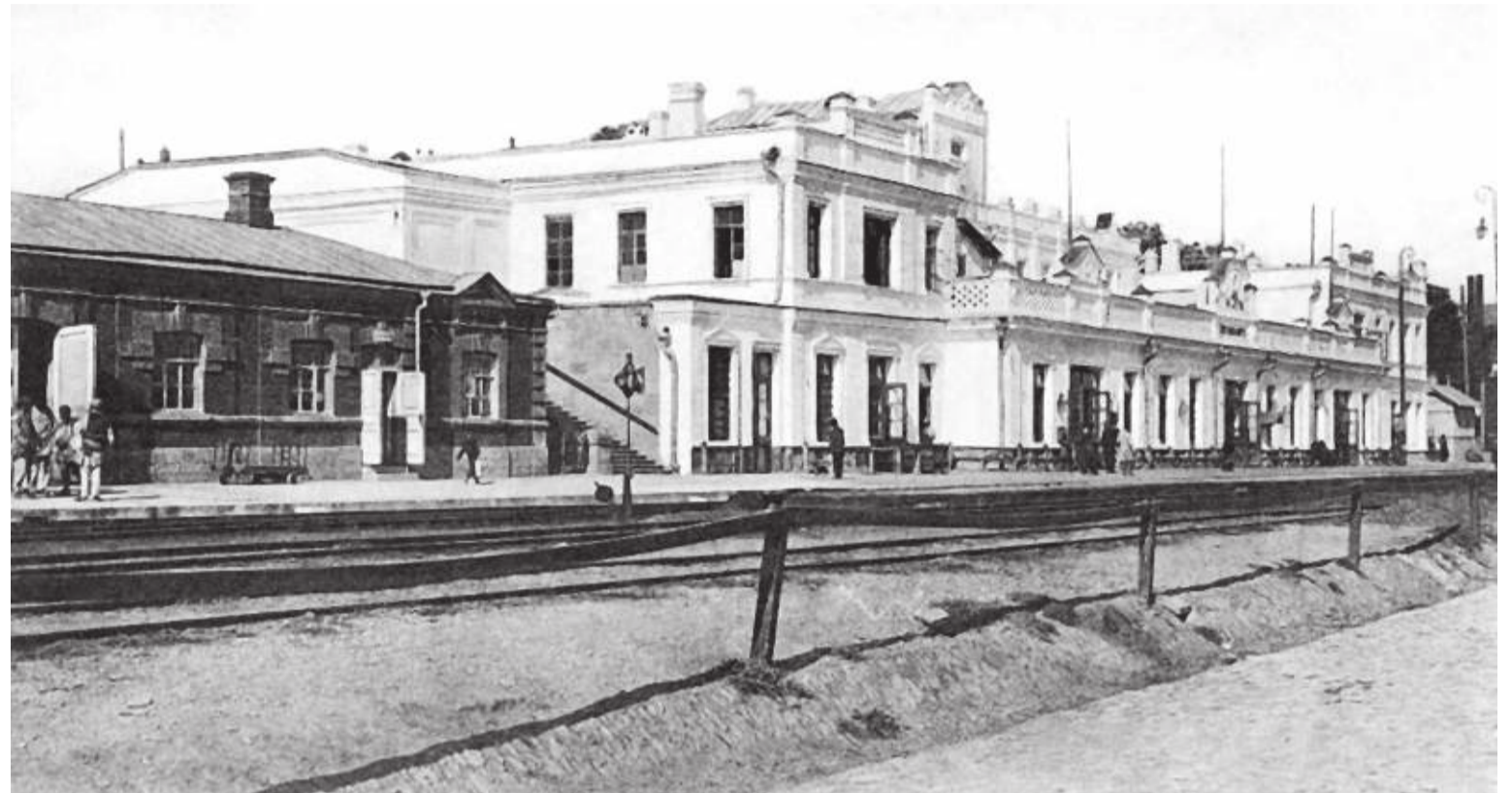
Вокзал в Петровске

Уже в апреле 1885 г. император утвердил решение кабинета министров о продолжении линии от