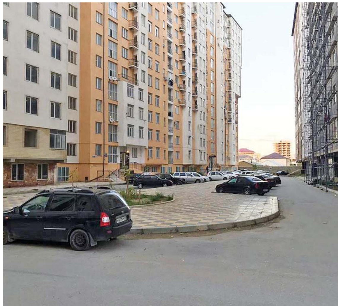
В домах по улице Азизова основная часть квартир предназначена для переселения граждан

– Причины разные. Все зависит от способа расселения. Например, в программе «2013-2017» расселение происходит путем при-