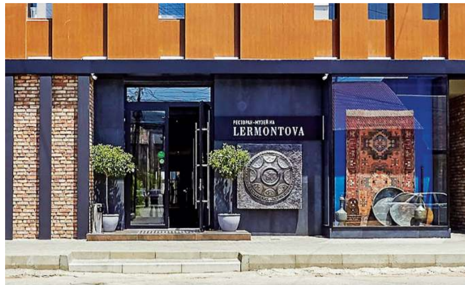
В экстерьере – идеальный баланс

Отметим цветовую гамму. Разные оттенки коричневого и классический черный