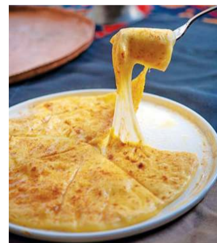
Дорого, но вкусно

Ресторану удалось-таки создать непринужденный, но в то же время много-