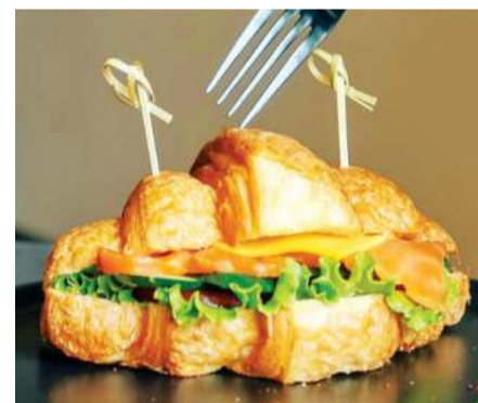
Круассан с лососем

Внутри приблизительно аналогичная картина, однако есть несколько интересных элементов. По интерьеру Love is berry очень похоже на приличные кофейни. Достаточно сдержанный антураж без резких перепадов в дизайне. Привычная барная стойка, мягкая мебель и спокойная атмосфера. Из вышеупомянутых интересных элементов выделим надписи на стенах.