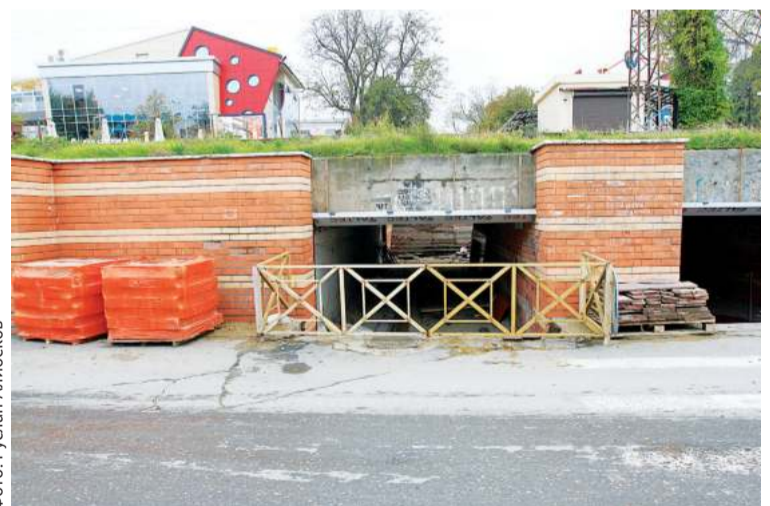
Подземный переход к пляжу приобретет современный вид

облицовка стен, которые мастера заново отштукатурили.