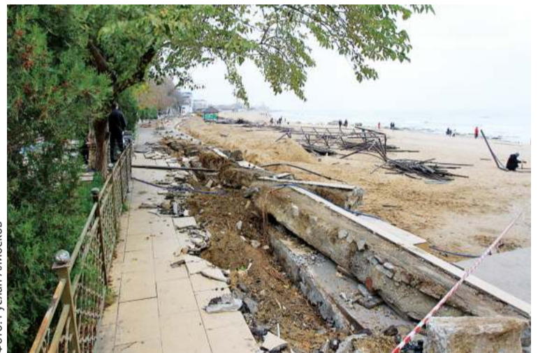
Демонтаж старых покрытий и тротуарных дорожек

На сегодняшний день ведутся работы по демонтажу старых покрытий, беседок, тротуарных дорожек. По проекту у нас предусмотрена замена тротуарной плитки,