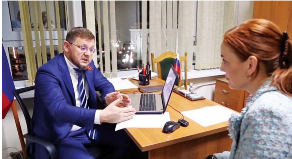
На контроле у мэра Махачкалы

Штаб располагается в здании администрации города, и чтобы семьи участников специальной военной операции могли, не выходя из дома, обратиться за помощью или получить консультацию, была