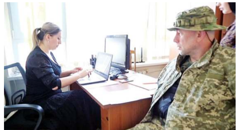
В штабе принимают посетителей