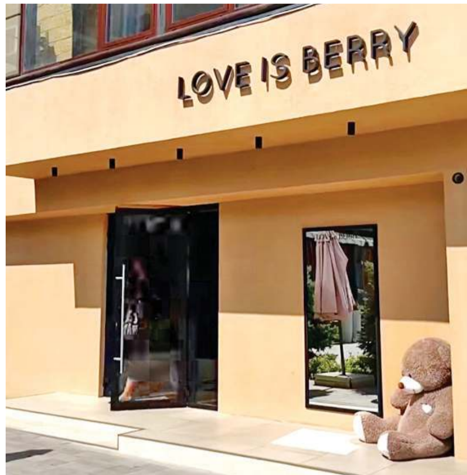
Внешний вид спасает фишка с зеркалом

Ну и похвалим сочетание оттенков. Цветовая гамма здесь действительно выдержана на хорошем уровне.