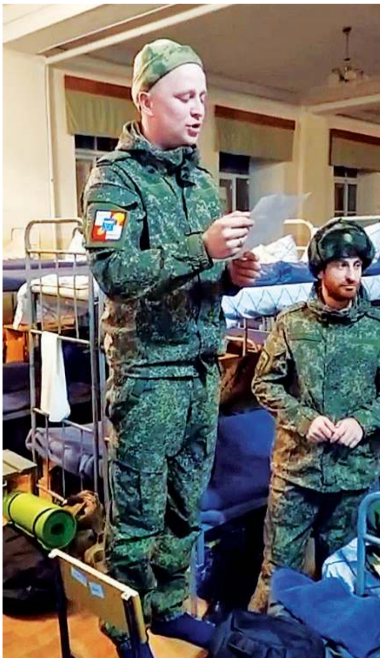
Участник СВО читает письмо дагестанской школьницы

акция «Посылка участнику СВО», вызвавшая живой отклик среди учеников разных классов. «Родители наших детей или их родственники принимают участие в СВО, поэтому предложение оказать посильную поддержку нашим воинам было воспринято родительским комитетом школы и детьми с большим одобрением. За неделю (!) собрали более сотни посылок. Почти все школьное фойе было заполнено коробками. В школе 60 классов, а посылки собрали 165. Почти в три раза больше. Кто теплые вещи принес, кто консервированные продукты, предметы гигиены, средства медицинской принадлежности – дезинфицирующие, обезболивающие. Но самое главное – все дети написали теплые письма поддержки нашим военнослужащим. В каждую посылку мы положили листки с посланиями и пожеланиями здоровья и скорейшего победного возвращения. Мы не ограничивали детей – некоторые писали коллективные послания от всего класса, или от себя – авторские, кто как хотел», – рассказал директор школы №18.