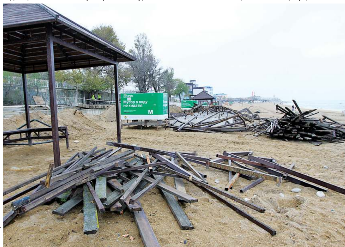
Теневые навесы и беседки будут обновлены