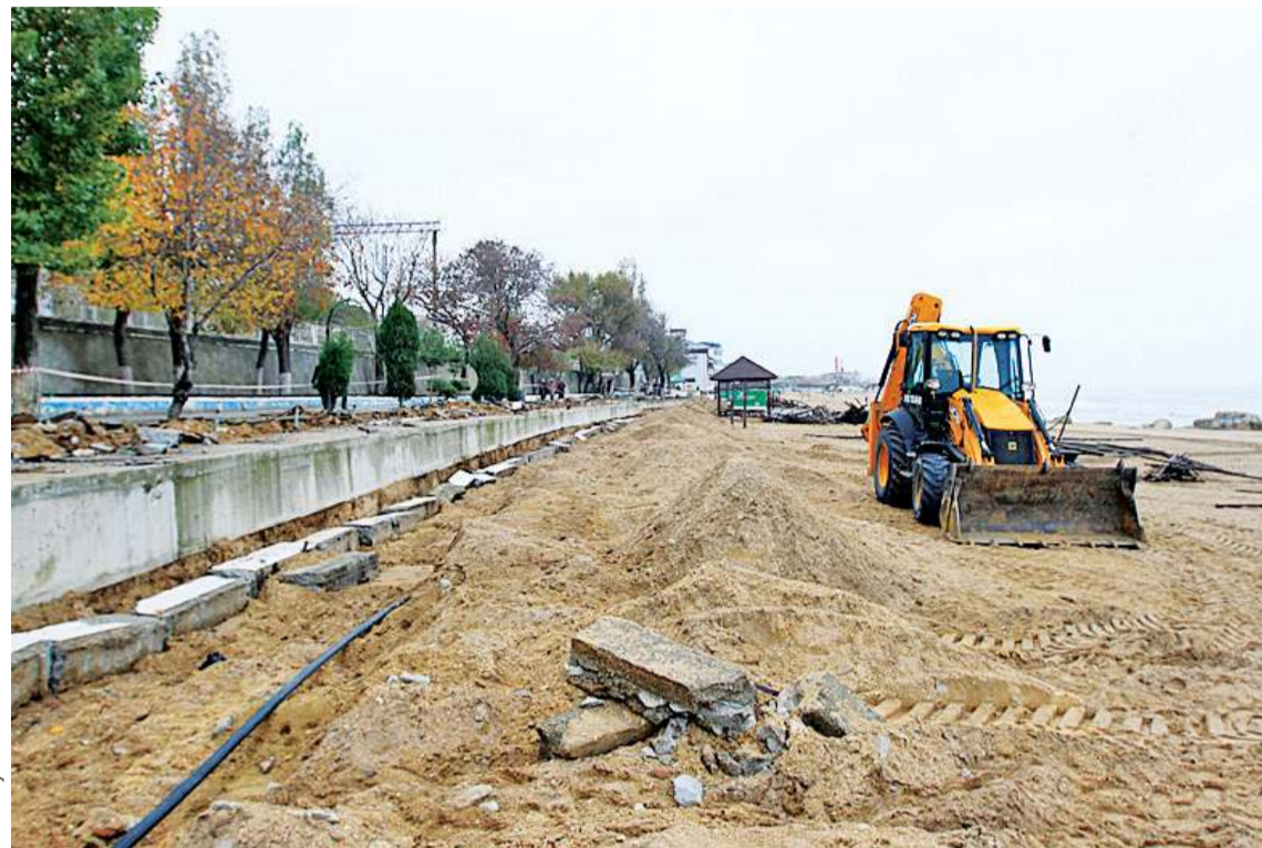
Из-за недостаточного объема выделенных средств ремонт пока затронет лишь центральную часть

Будет обновлена входная группа. Также будет установлено дополнительное декоративное освещение с подсветкой деревьев на территории Родопского бульвара