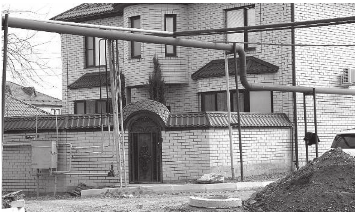
Выглядит все это в XXI веке не очень

Мы уже писали на примере поселков Ленинкент и Шамхал о том, что виды отремонтированных улиц зачастую далеки от идеальных. Однако сила инерции любых механизмов в нашей стране чрезвычайно велика, поэтому придется запастись терпением.