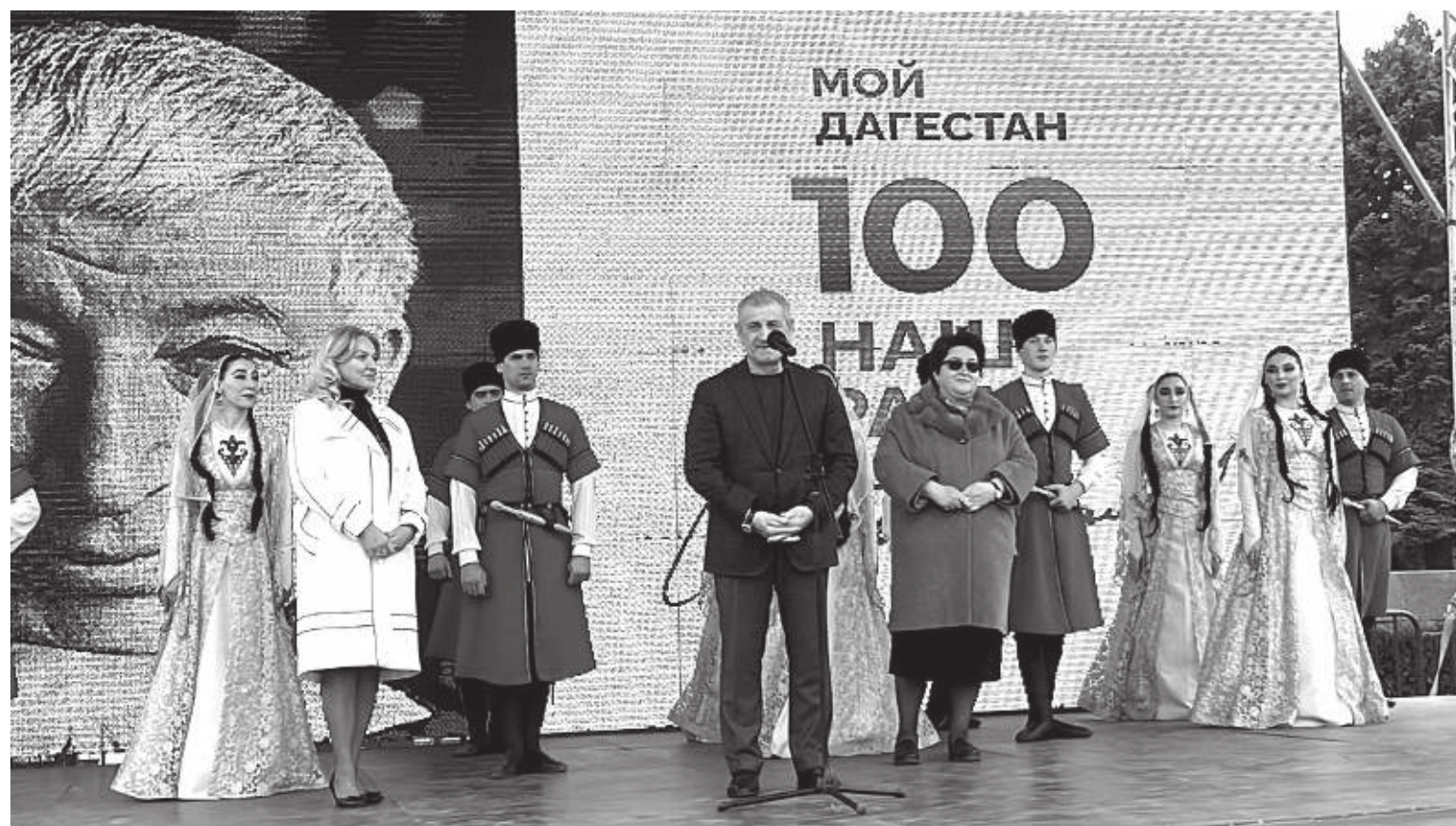
Концерт, приуроченный к 100-летию Расула Гамзатова