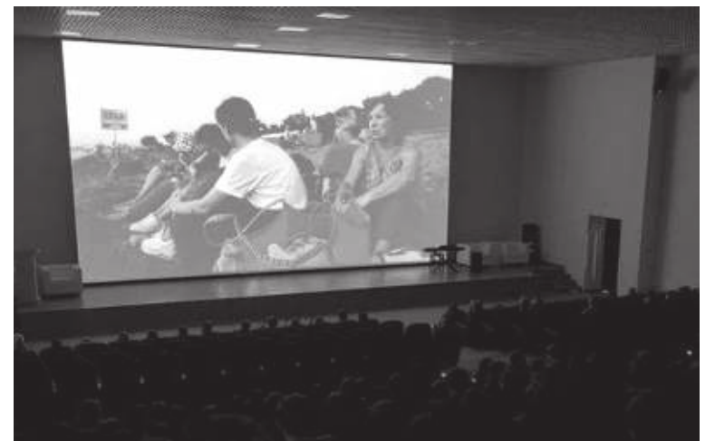
Кадр из фильма «Квартет»

«Все это было сложно: ты занимаешься подработками, снимаешь какие-то репортажи или продюсируешь съемки для других журналистов, чтобы как-то выжить, а в