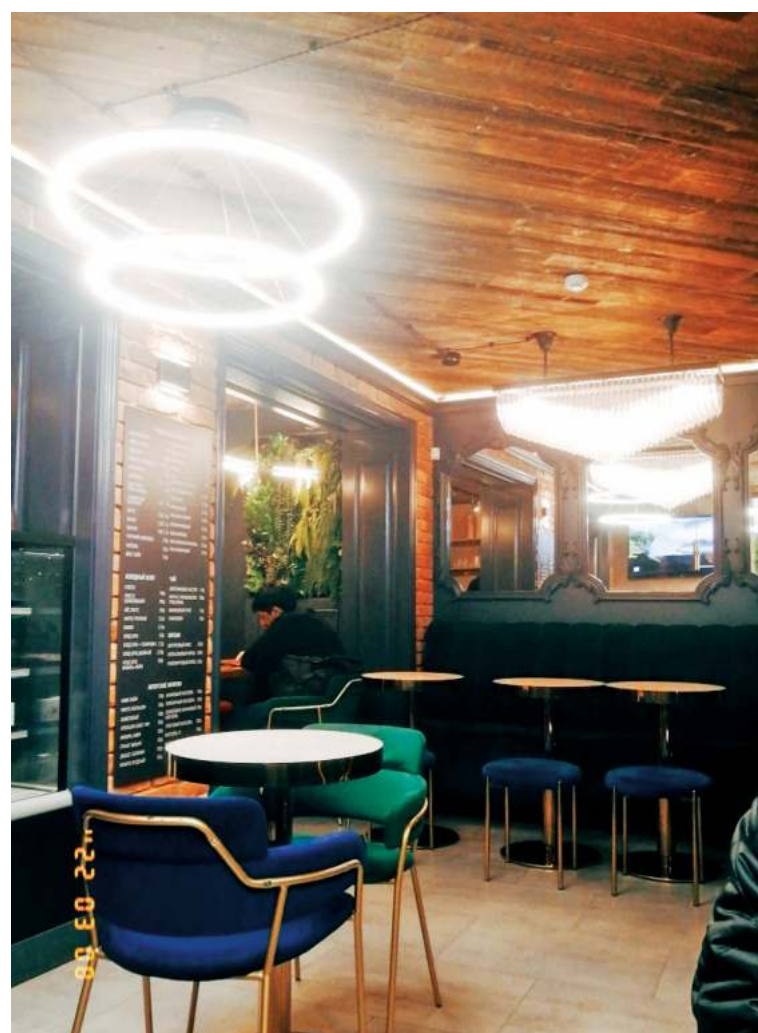
Древесные оттенки и кирпичные стены отлично гармонируют между собой