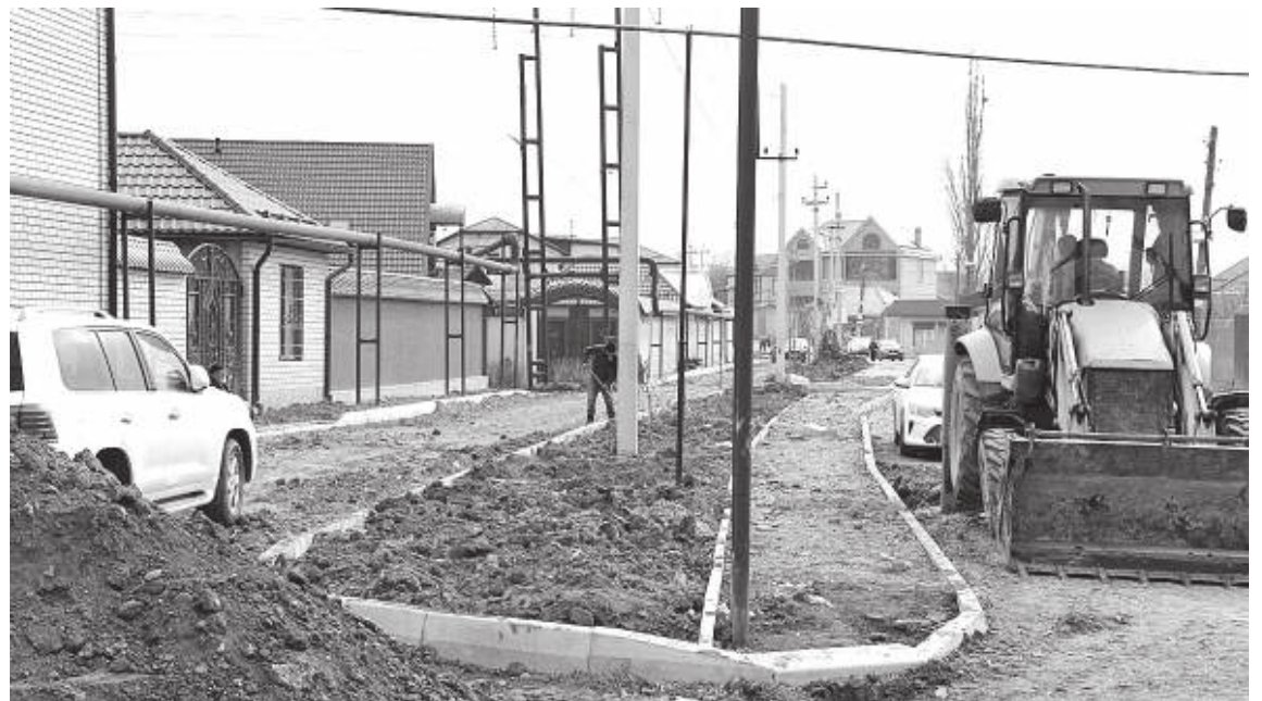
Фото 2. Мест для тротуаров по обочинам нет

Еще один вопрос: огромная газовая магистраль, проходящая в опасной близости от домов.