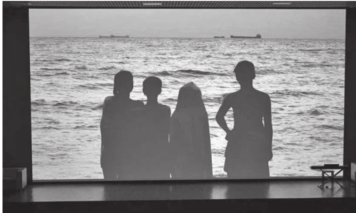
Кадр из фильма «Квартет»

«... Фестиваль на протяжении многих лет выполняет благородную миссию – содействует сохранению памяти о беспримерном подвиге наших народов в борьбе с