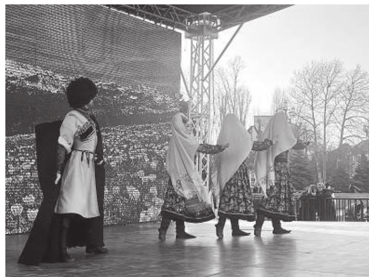
Выступление танцевального коллектива