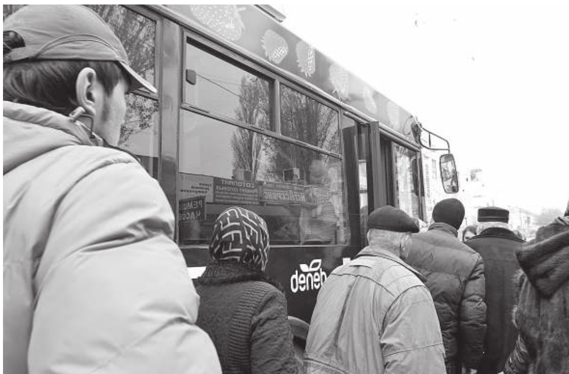
В пригороды можно ездить на автобусах

Л.Д.: Пассажиров условно можно разделить на тех, кто предпочитает автобусы, троллейбусы и тех, кто садится только на маршрутки. Автобусы и троллейбусы выбирают, как правило, пенсионеры. Их устраивает относительно низкая цена и средняя скорость поездки. И в целом, независимо от возраста, если пассажир не спешит, то почти всегда он выбирает то, что подешевле. Работающее население и учащиеся вузов выбирают исключительно маршрутное такси, где цена выше, но пассажир понимает, что платит не только за удобство в поездке, но и за скорость перемещения. И опять мы возвращаемся к той проблеме, что увеличить скорость перемещения в городе даже на маршрутных такси невозможно