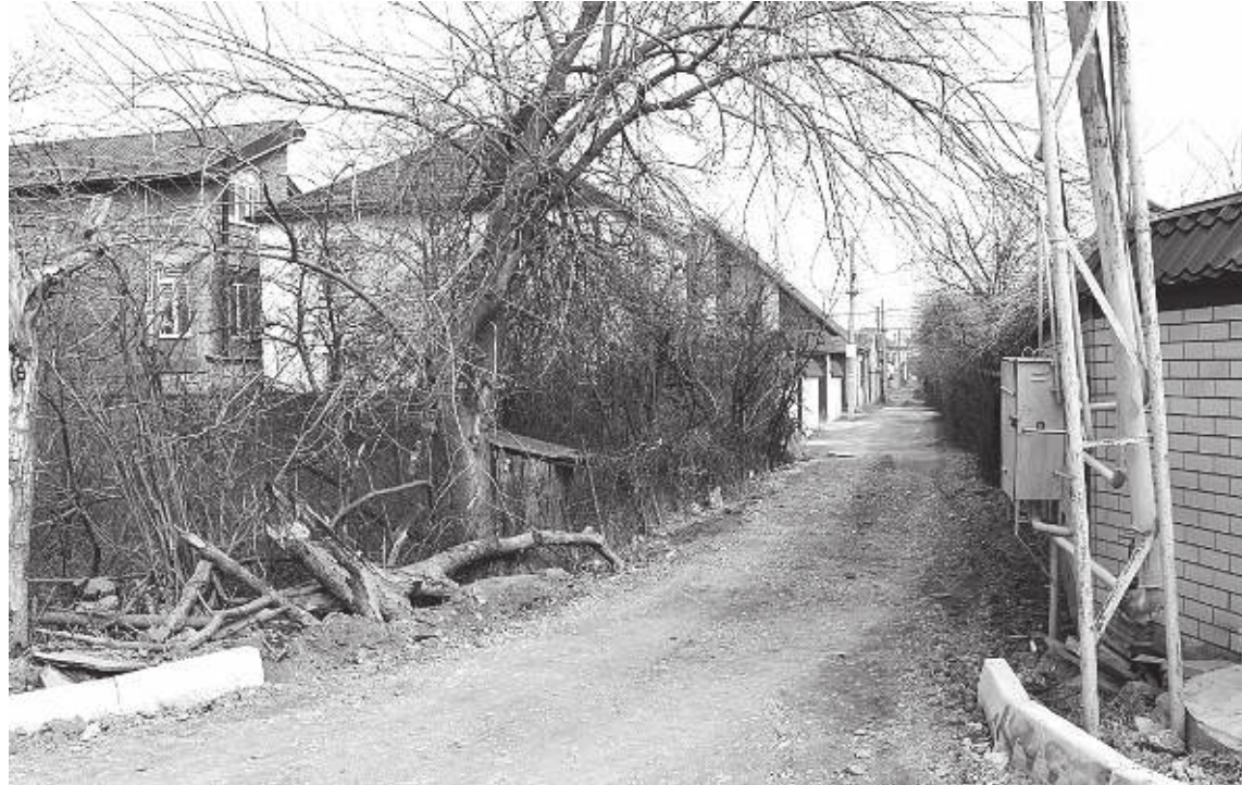
Фото 1. Нагромождение труб прямо перед входом в дом. На заборе все еще видны следы падения дерева

С такой ситуацией столкнулись жители улицы Межквартальной, мкр «Дружба», где сейчас полным ходом идет ремонт. Один из жителей мкр даже обратился на имя главы РД Сергея Меликова с просьбой вмешаться и что-то сделать с сетью газопроводов, которые идут в соседний квартал, и газораспределительным шкафом, установлен-