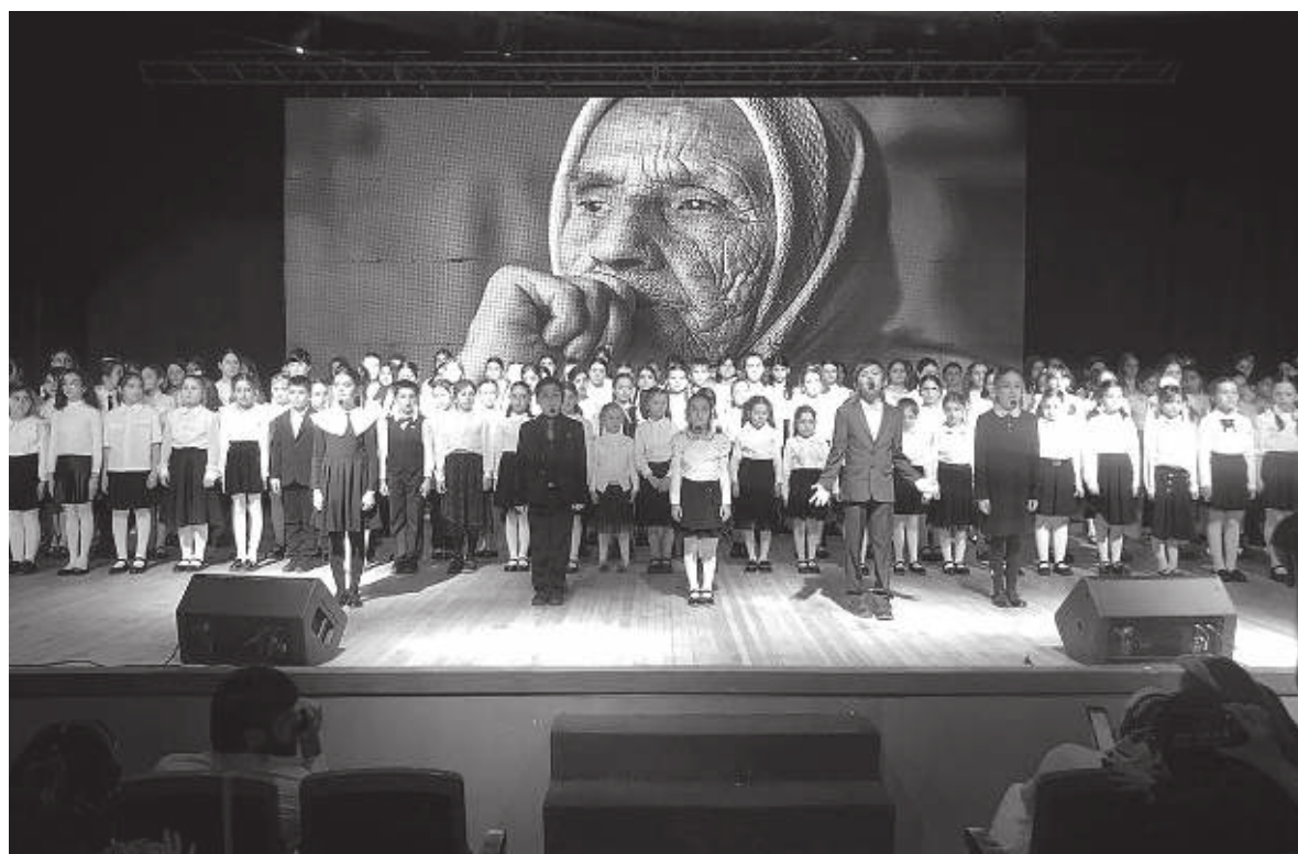
Празднование Международного женского дня

По материалам пресс-службы Управления культуры Администрации г. Махачкалы