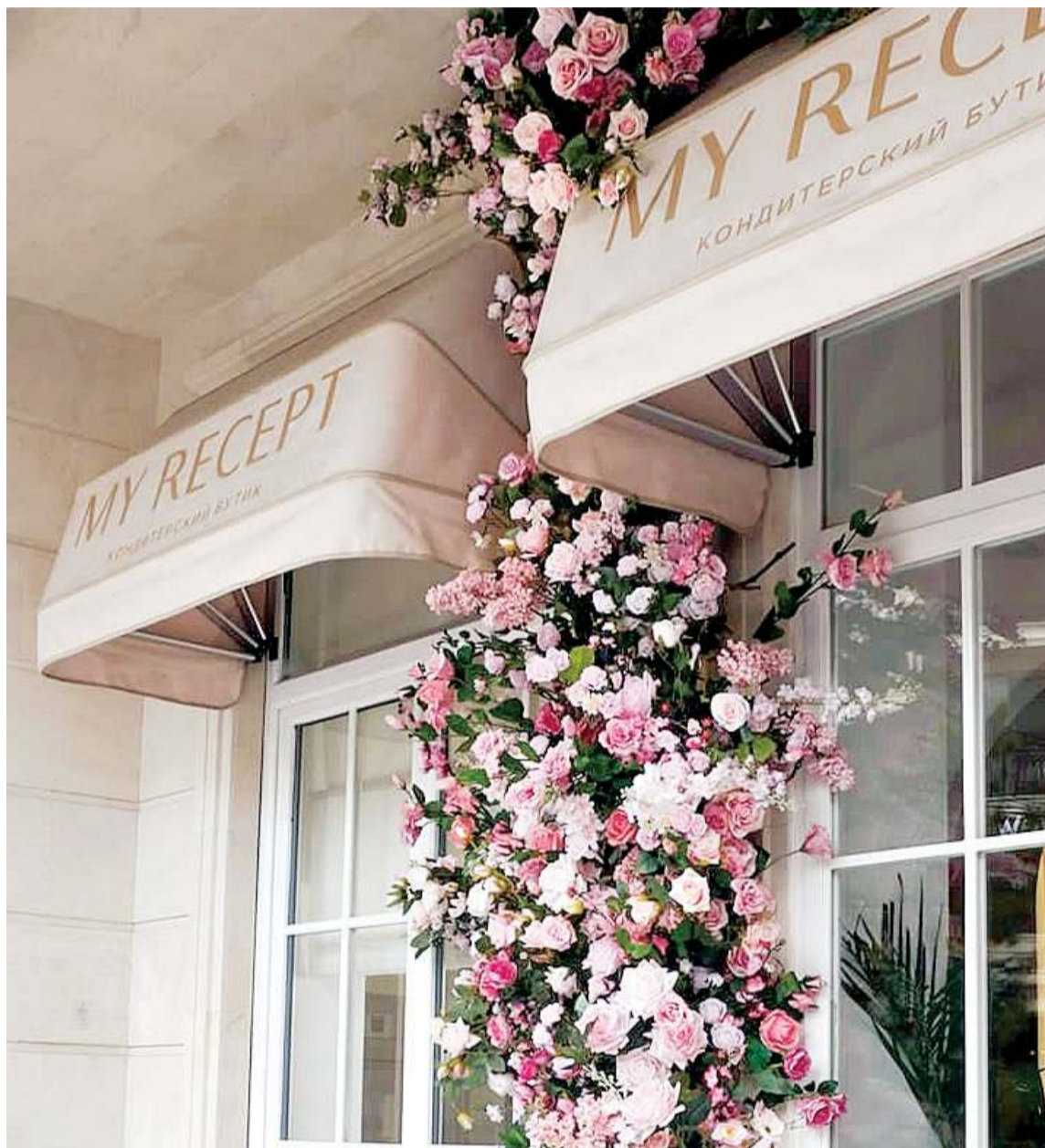
Внешний вид заведения радует глаз

Выдержанная цветовая гамма, невероятно удобная и красивая мебель, роскошные элементы декора, как, например, люстра из множества цветов – все это дает мне полное право поставить