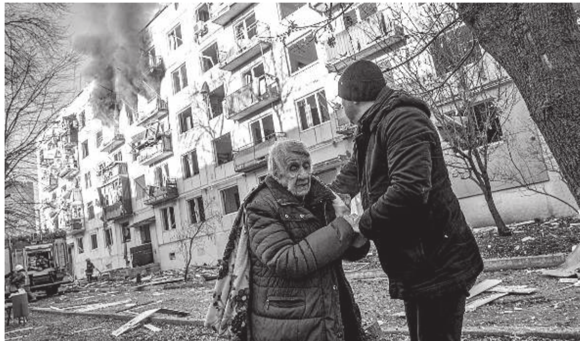
Жители Донбасса прошли через ад

«В самом начале СВО, когда мы прибыли с гуманитарной миссией на Донбасс, в частности, Мариуполь и другие города, местные жители с опаской смотрели на нас. Мы понимали, что эти люди были настолько запуганы пропагандой о плохих русских, которые придут и будут все разрушать. Но постепенно они поняли, что русский солдат им не враг и пришел он спасать их от нацистского режима, очень дружелюбно стали относиться. Многие даже в слезах спрашивали: «Вы же не уйдете от нас? Только не бросайте нас», – просили. Эти люди за те восемь лет киевского нацистского режима столько горя повидали, что в российских людях они искали и нашли своих спасителей. Особенно горько было смотреть на взрослых, как они плакали, когда принимали продукты от нас. Но то, что они рассказывали нам, – это, конечно, намного страшнее того, что мы видим в фильмах о немецком фашизме во время Великой Отечественной войны. Невозможно было спокойно слушать рас-