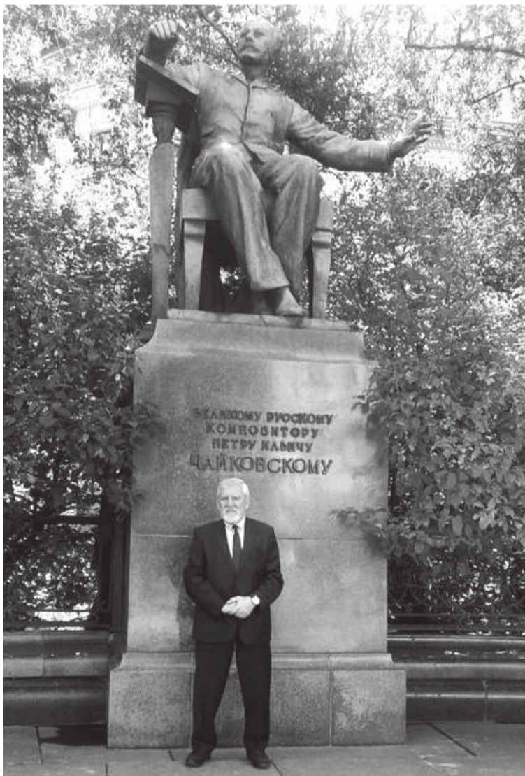
У памятника Петру Чайковскому

P.S. Пока готовился этот материал к выпуску, нам стало известно, что пианист Хан Баширов отмечен Благодарностью главы региона Сергея Меликова за особые заслуги в сфере культуры и искусства и Почетной грамотой Народного Собрания РД. Отметим, что maestro также является народным Героем Дагестана, почетным гражданином Махачкалы.