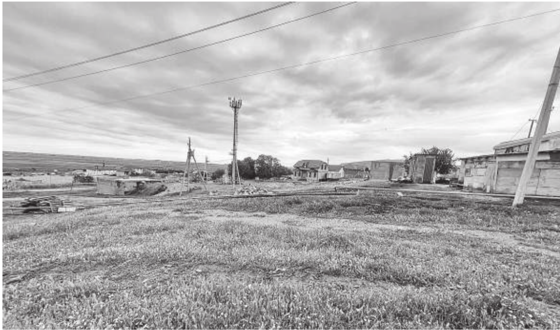
Поселок состоит примерно из 700 хозяйств

Вдоль республиканской дороги, проходящей по окраине (сейчас уже в черте) поселка и соединяющей две федеральные трассы – Хасавюртовскую и Сулакскую, некогда красовалась густая лесополоса протяженностью около трех километров и шириной около 20