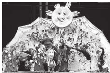
Дагестанский театр кукол представит вашему вниманию успешный многим

Волк остается ни с чем! Конечно же, помогают главной героине и ее друзья.