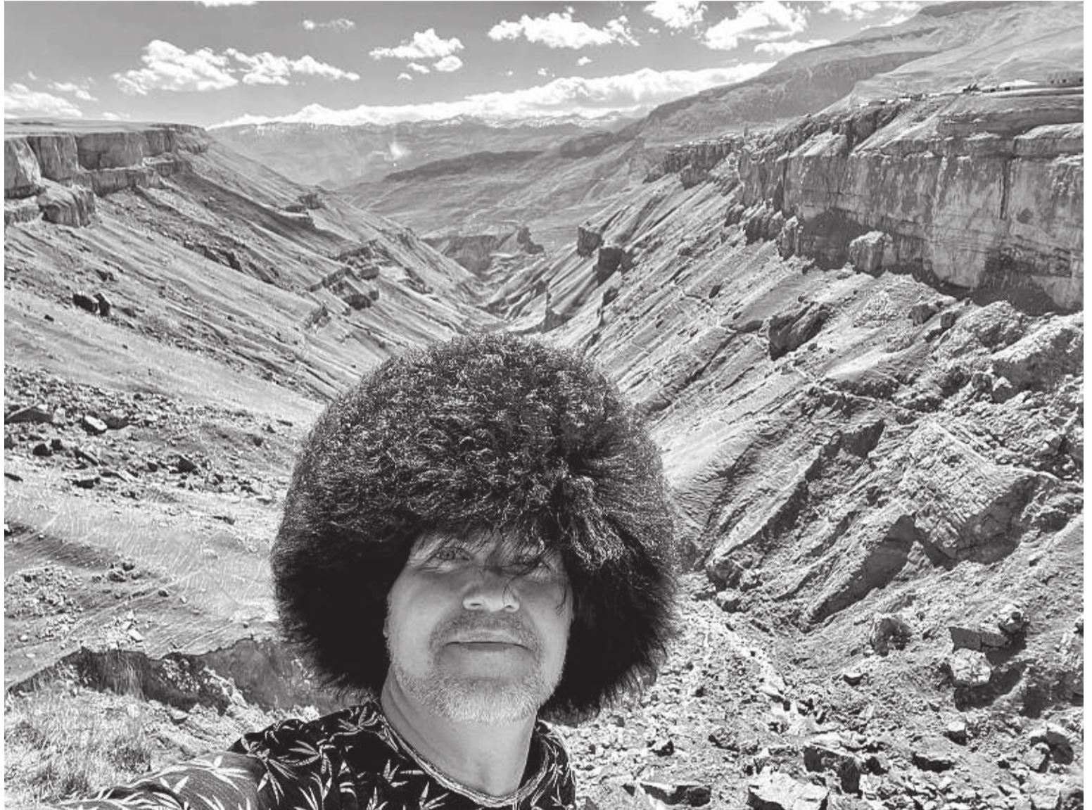
Роскошные горы и каньоны

Путешествия в моем творчестве, как мелодии: они все разные, звучат на разных инструментах, в своей тональности и жанре. Я делаю для этих мелодий аранжировку, чтобы донести замысел от полученных впечатлений до моего читателя. С хорошей рифмой, как с хорошей песней – все путешествия гораздо интересней!