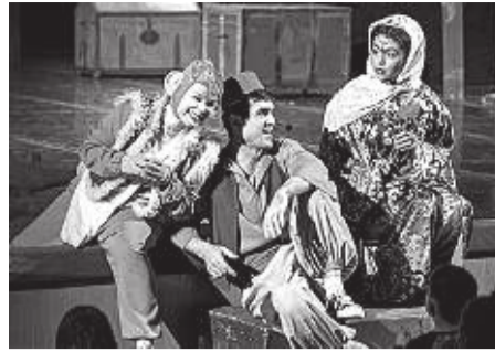
Режиссер-постановщик спектакля – Нелли Плевакова .

Зрителей ждут настоящие приключения, сказочные чудеса и Джин из волшебной лампы. Это мир красок Востока, где витает аромат восточных сладостей и экзотических фруктов. Песни, музыка, зажигательные танцы не оставят равнодушными всех, кто увидит этот спектакль.