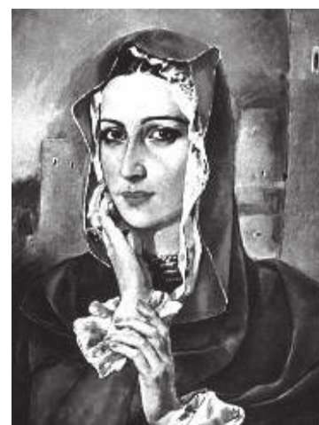
«Аварка из Чоха»