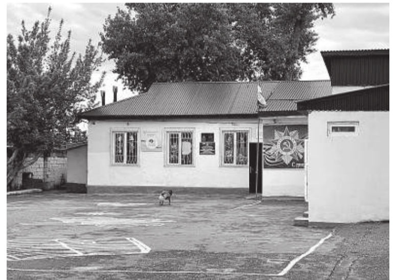
Средняя школа расположена прямо на границе с колонией

Одна из острых проблем поселка – отсутствие общественного транспорта. Маршрутки в этот поселок не ходят, есть только проезжающие, которые тоже в час пик переполнены. Об автобусах и думать уже забыли. Люди часами ждут или добираются автостопом до города. Раньше здесь была конечная остановка 188-го маршрута, теперь же маршрут проходит через Шамхал-Термен.