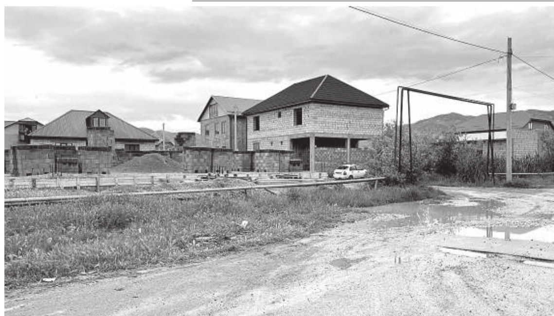
Одна из острых проблем поселка – отсутствие общественного транспорта

процесса. Не исключено, что в новой тоже будут заниматься в три смены, учитывая, что рядом с этой школой возводится жилой многоэтажный комплекс. Добираться до новой школы из Загородного дети смогут на автобусе, но для этого понадобится 20 машин, или же дети будут «рассыпаны» по всей трассе в утреннее и вечернее время. Такая картина, вероятно, будет наблюдаться в обоих поселках.