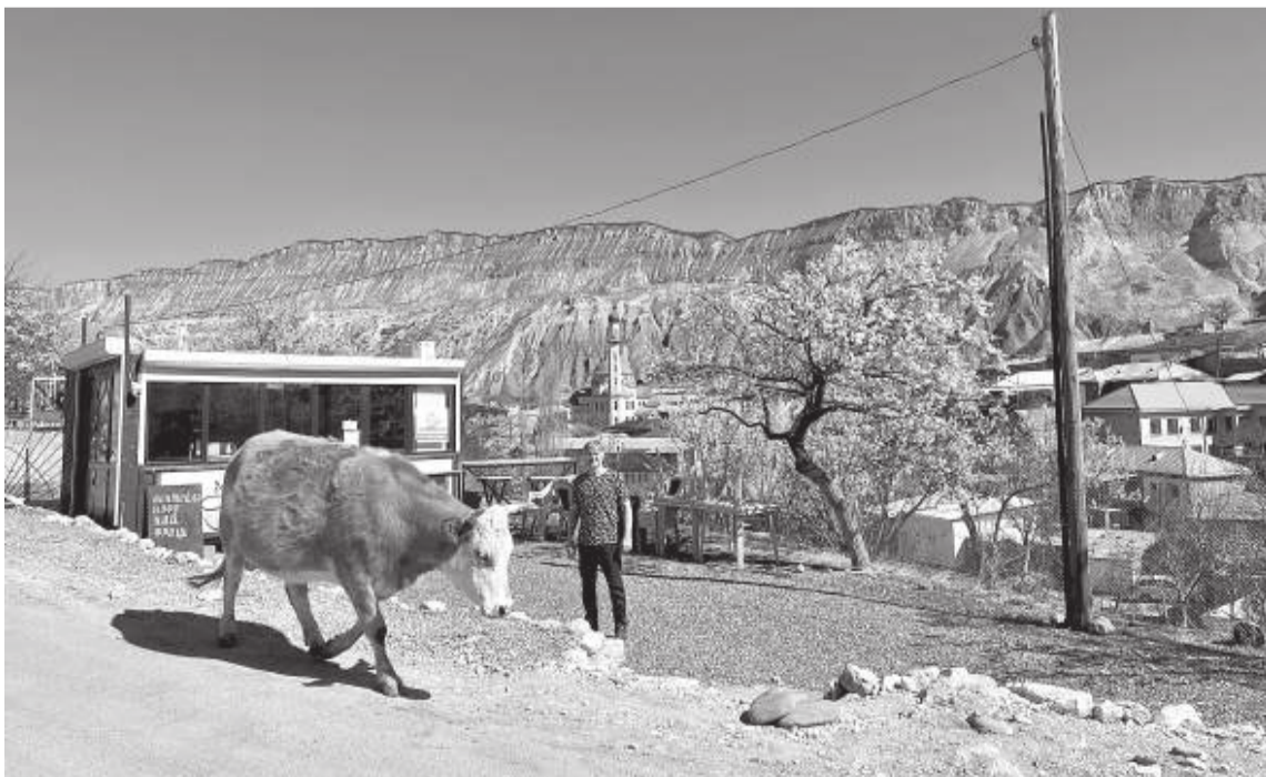
Где-то в горах...