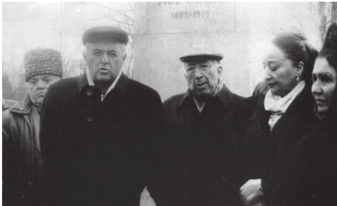
С народными поэтами Дагестана Расулом Гамзатовым (в центре) и Фазу Алиевой (справа)