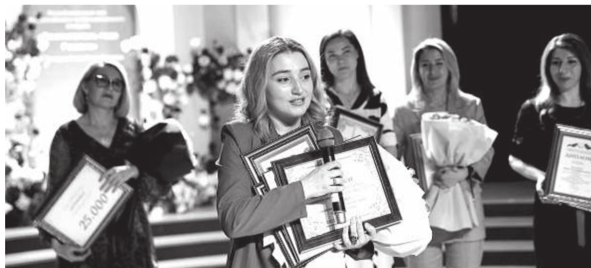
На заключительном этапе конкурса

Существуют еще негласные критерии выбора участника: методические наработки, стрессоустойчивость, коммуникатив-