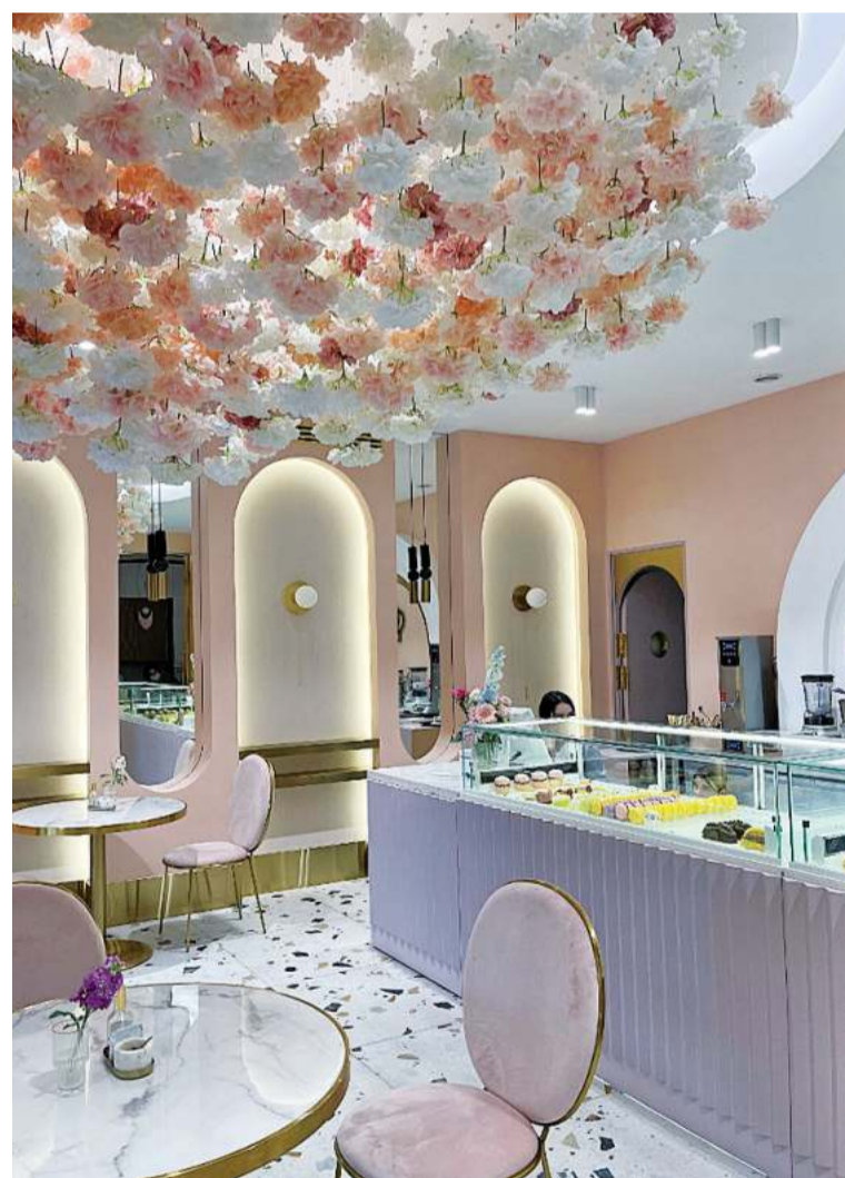
Внутри все похоже на сказку