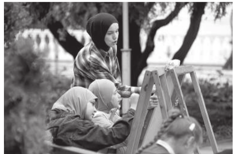
Для детей были подготовлены развлекательные мастер-классы

Мэр также отметил, что в текущем году в Махачкале ремонтируется 71 улица по национальным проектам и региональным программам, благоустраиваются 5 общественных пространств, за которые в ходе рейтинговых выборов проголосовали махачкалинцы. Капитально отремонтированы 14 школ, введены в эксплуатацию 3 новые современные школы и 1