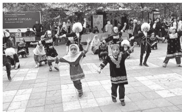
Выступление детских школ искусств

В этом году организаторы праздников заняли территорию парка под мероприятия и разделили его между внутригородскими районами, которые устроили свои подворья. На всей протяженности общественного пространства воспитанники детских школ искусств города и популярные исполнители дагестанской эстрады представляли свои концертные мероприятия. Также приглашенные из горных районов коллективы Домов творчества организовали национальные подворья, где в течение