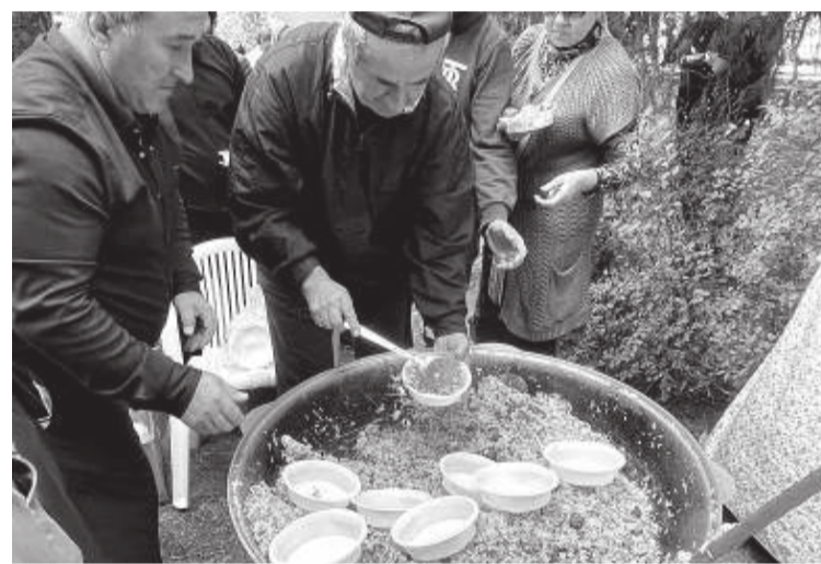
Желающие могли угоститься блюдами национальной кухни

Также с самого утра на ул. Пушкина открылась сельскохозяйственная ярмарка. В завершение праздника на летней площадке филармонии прошел концерт мастеров искусств.