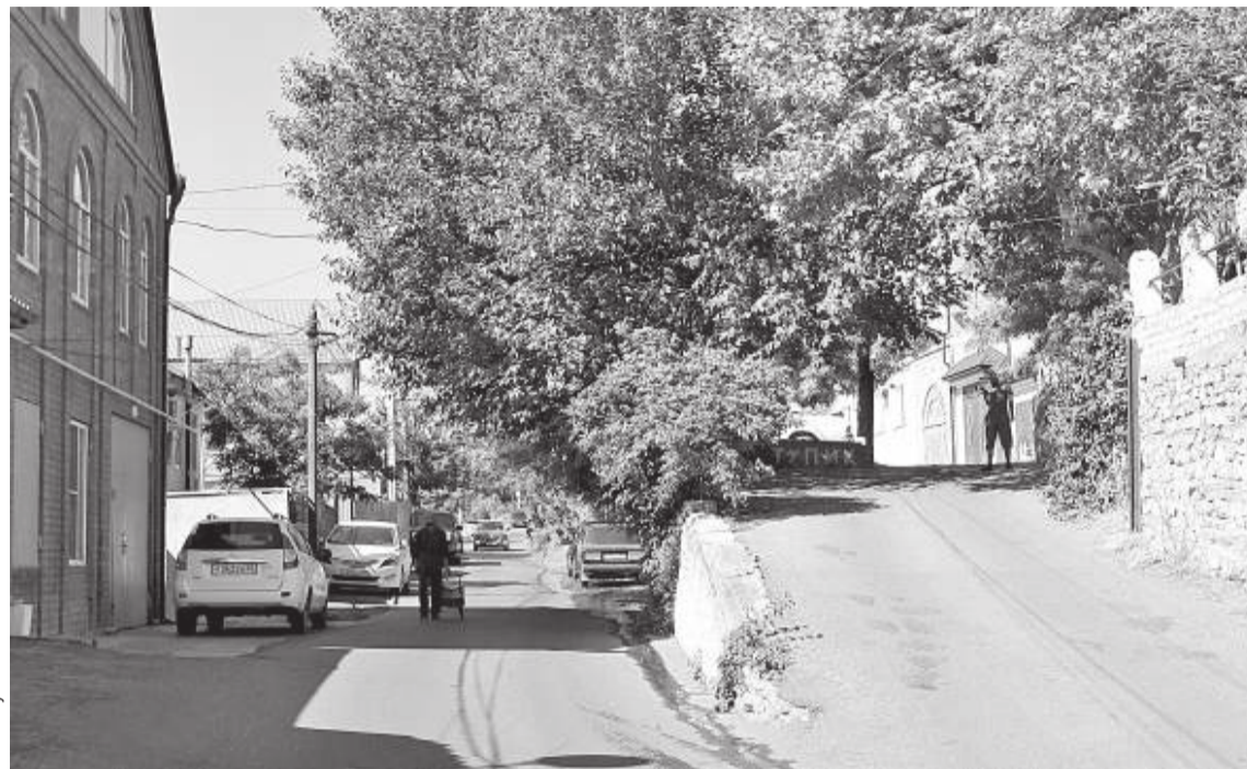
Ландшафт улицы состоит из верхней и нижней частей

Несмотря на то, что эта улица не относится к центральным городским артериям, ул. Магидова – одна из тех, что создает уникальную городскую культуру Махачкалы. Она вписывается в городской ландшафт, имеющий своеобразное очертание в этой части столицы. С учетом этого жители строили здесь дома, создавая всевозможные переходы, переплетения и градации. Улица располагается на скалистой возвышенности, оттого имеет раздвоенную структуру и этим впечатляет «путешественника», желающего свернуть с шумной ул. Гаджиева куда-нибудь в тихий район. Условно говоря, улицу можно разделить на верхнюю и нижнюю, каждая из которых живет своей полноценной жизнью. По крайней мере, придомовые территории, парковочные места и прочие удобства городской жизни здесь представлены в достаточном