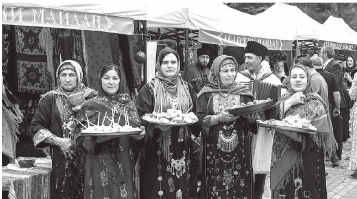
Какой праздник без угощений и вкусностей?

Также в рамках концертного мероприятия в честь празднования Дня города, глава Администрации г. Махачкалы по сложившейся традиции наградил отличившихся работников муниципальной службы, в том числе работников коммунальной сферы за добросовестный труд. Им были вручены именные часы.