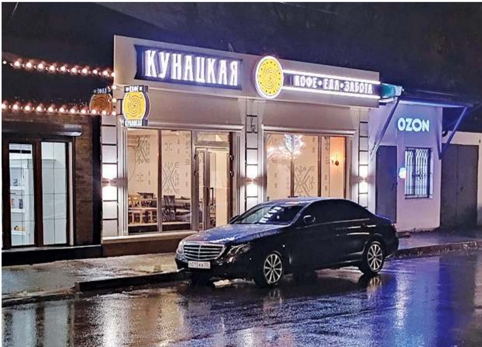
Внешне - просто и незамысловато

Снаружи кафе «Кунацкая» выглядит так, будто экстерьер современных кофеен соединили с дагестанскими мотивами. Все выглядит весьма просто и незамысловато. Здание практически полностью имеет белый оттенок. Да, этот цвет можно назвать заезженным,