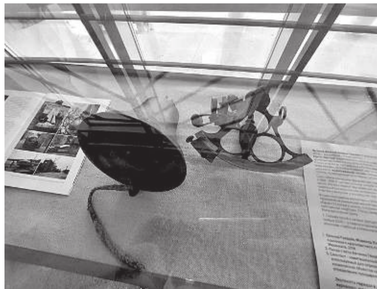
Рында и секстант с яхты Гвоздева

А эти фотографии... Живая история города.