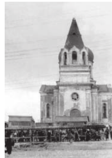
Вид на Собор во имя святого благоверного князя Александра Невского, 1948 г.

Об этом узнала тогдашний министр культуры СССР Фурцева , и за такое самоуправство отправила музыканта на гастроли в Махачкалу вместо Парижа.