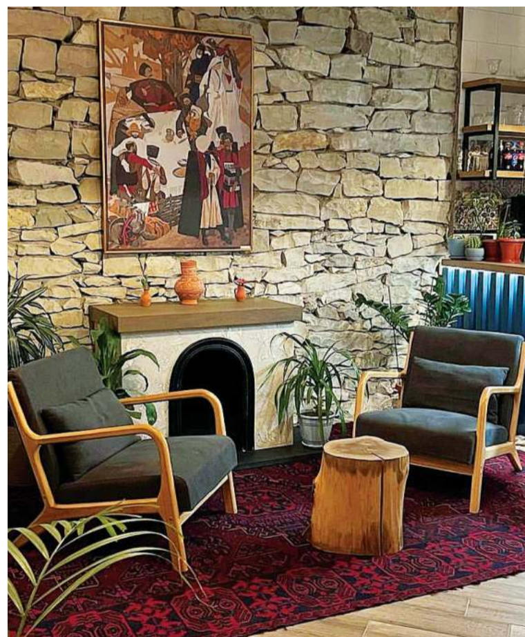
Дизайн составлен из элементов дагестанского быта

однако при правильном исполнении и точечном добавлении элементов декора получается хороший результат. Экстерьер «Кунацкой» является подтверждением моих слов.