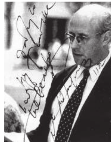
Мстислав Ростропович в Махачкале, 1972 г.