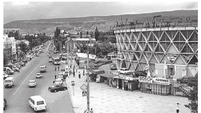
Здание Анжи-базара в Махачкале

Еще на память приходит копченый запах, витавший в магазине по ул. Ленина, там, где сейчас находится магазин ювелирных изделий