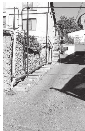
Лестницы, лесенки, подъемы...

Наименование улицы обозначено табличками почти на всей ее протяженности, однако, следуя древней махачкалинской, а может, и общедагестанской традиции, номерами обозначены не все дома. Поэтому в случае необходимости понадобится подключить собственную логику и воспользоваться ориентирами. А для тех, кому интерес-