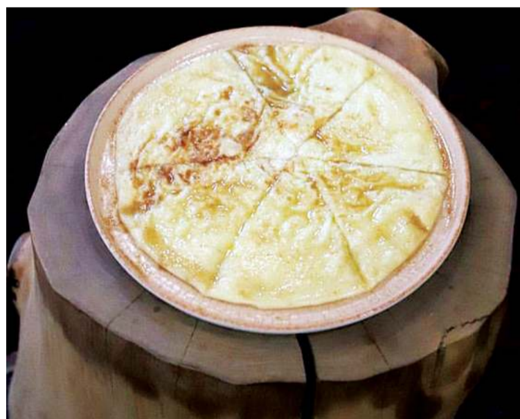
Жирно, сырно, «нажористо»

Как и предполагалось, основу здешнего меню составля-