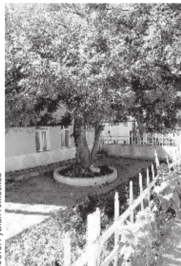
Ухоженный дворик. Один из...