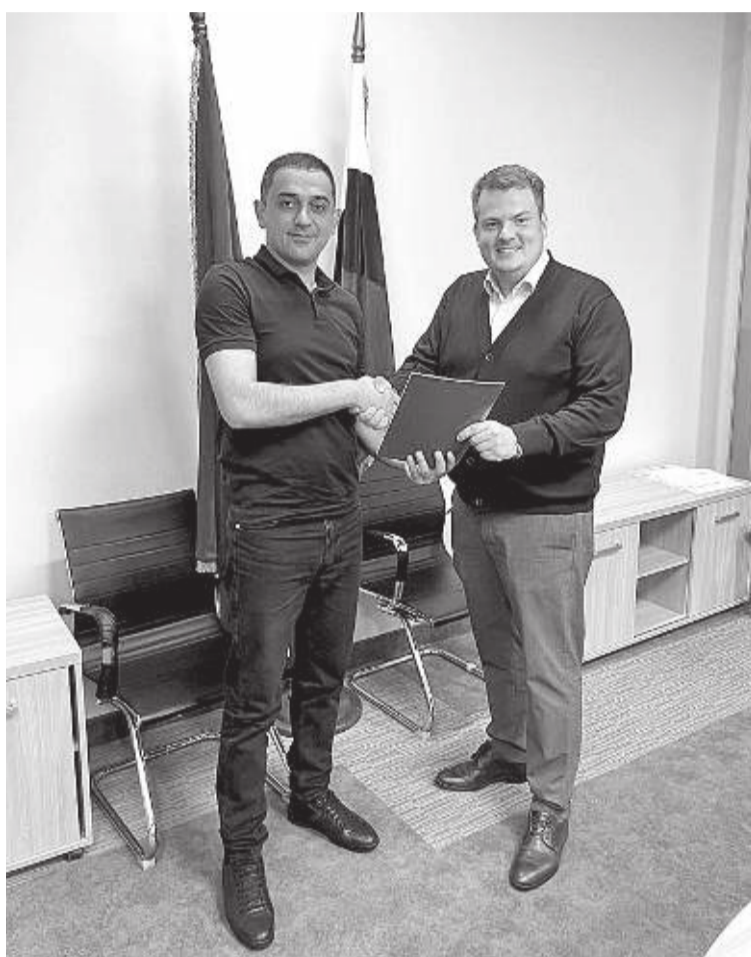
Подписано соглашение о взаимодействии

«Технические средства в процессе движения осуществляют фиксацию и передачу в подразделения ГИБДД информации о нарушениях скоростных режимов, правил обгона и маневрирования, правил парковки и стоянки транспортных средств. Также в этом году мы разместили 18 комплексов в составе систем «Умный пешеходный переход», чтобы обеспечить предупреждение водителей о при-